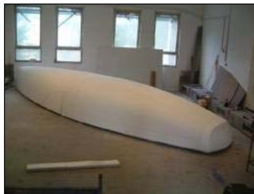
Skroget får elegante linjer